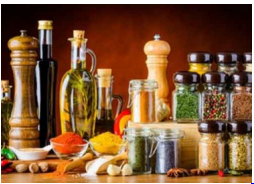
Essig, Öl, Senf, Gewürze, Süßes