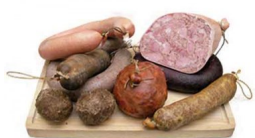
Frischwurst - Hausmacher