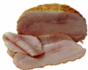
Saftiger und zartfleischiger Farmlandschinken